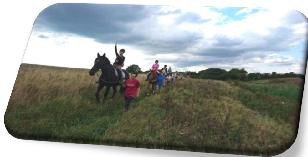
Billede fra sommerens Tilflytterarrangement

Følg os på Facebook og på www.broagerlands-rideklub.dk